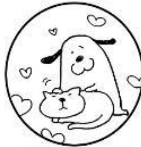
動物にさわった時