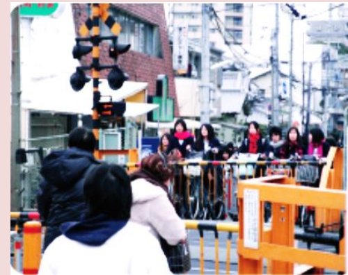
踏切の遮断時間が長く、人や自転車が錯綜