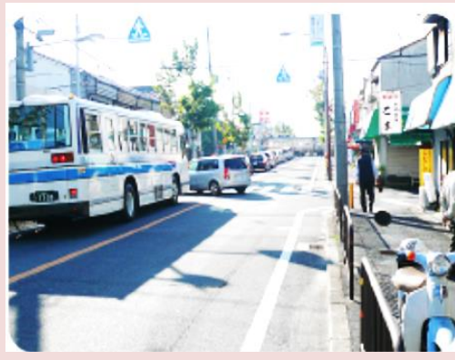
踏切付近では、慢性的な渋滞が発生