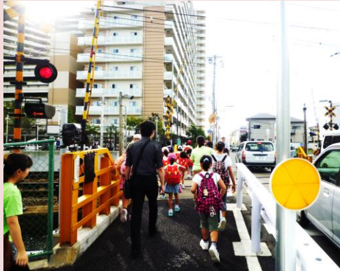
鉄道が地域を分断