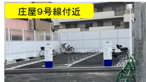
摂津市駅駅前の駐輪場(定期利用のみ)を移設

仮設線路の設置に伴う支障移転工事を行っています。ご不便をおかけしますが、引き続きご協力をお願いいたします。