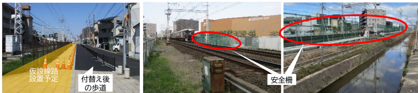
仮設線路の設置スペースを確保するため、歩道の付替えを実施