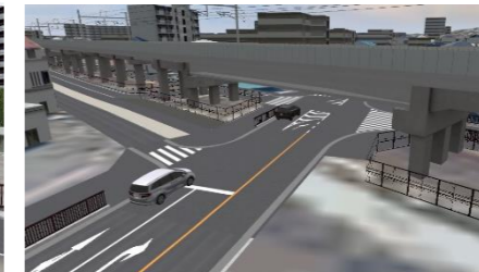
高架後の千里丘踏切付近