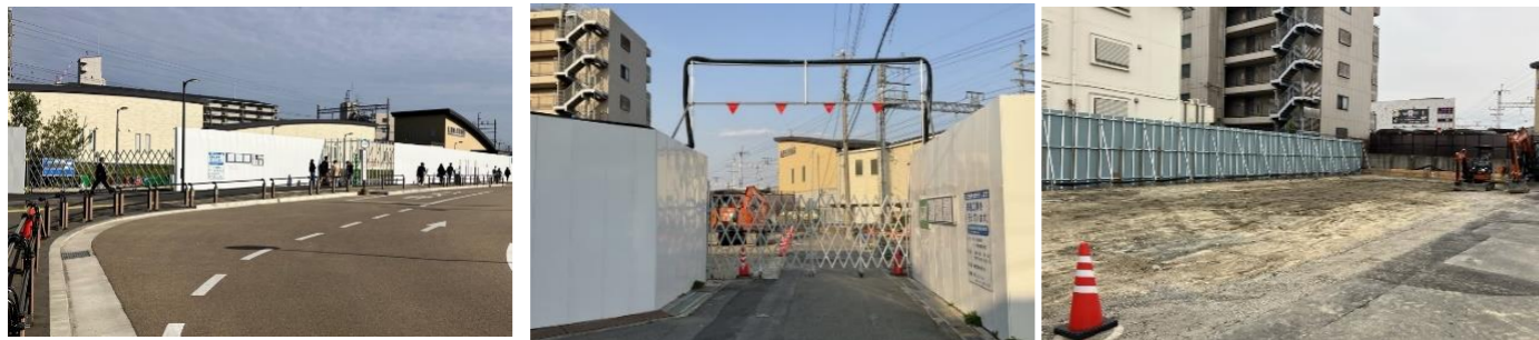
仮設駅舎工事に伴い、仮囲いフェンスを設置