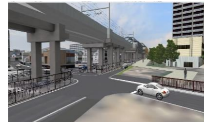
高架後の坪井踏切付近

本事業が完成した後の鉄道高架・側道整備イメージを疑似体験できる3DVRシミュレーションを、摂津市連続立体交差推進課の窓口で体験出来ます。詳しくは摂津市HPをご参照下さい。