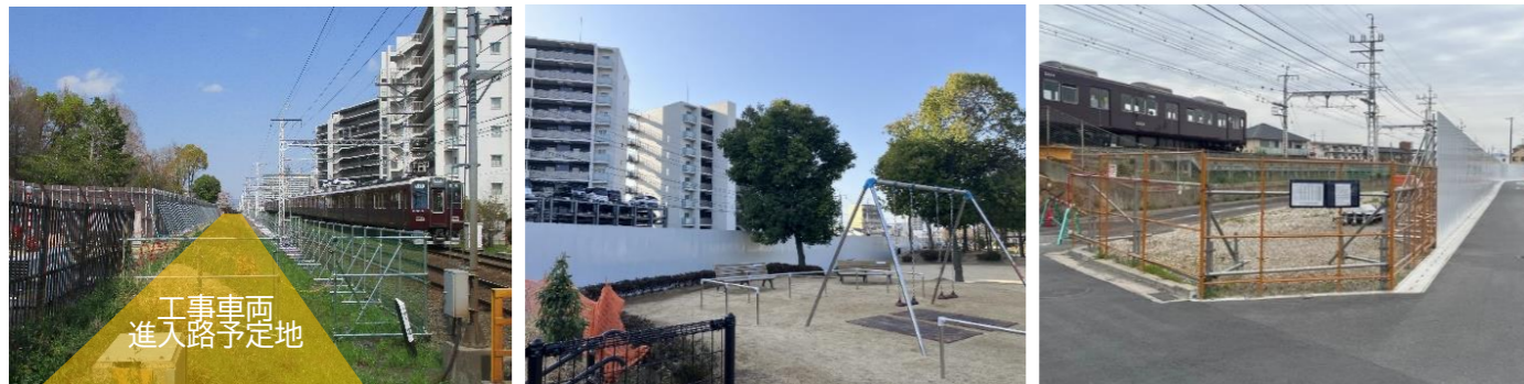
工事車両進入路整備工事に伴い、仮囲いフェンスや安全柵を設置