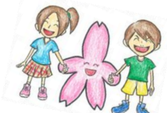
三宅柳田小マスコットキャラクター「みやなちゃん」