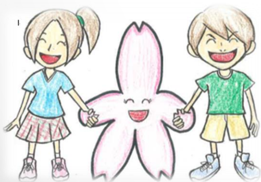
三宅柳田小マスコットキャラクター「みやなちゃん」