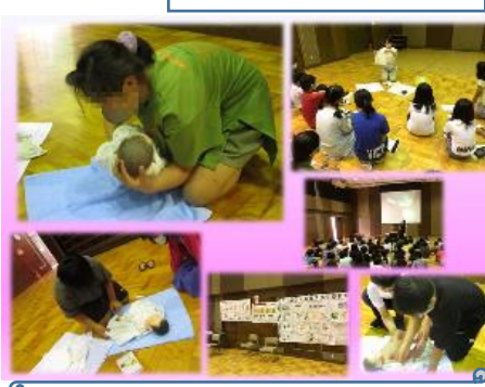
6年生 赤ちゃんふれあい体験