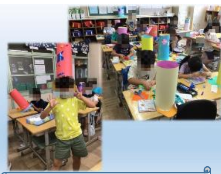
2年生 図工:すてきなぼうし