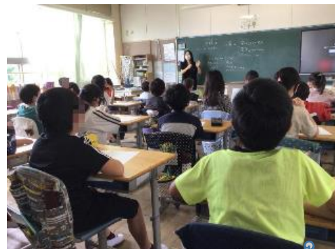
4年生 いじめ予防授業