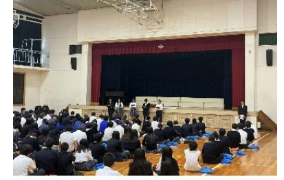
202510 『安居楽業』 半年間ありがとう🥰