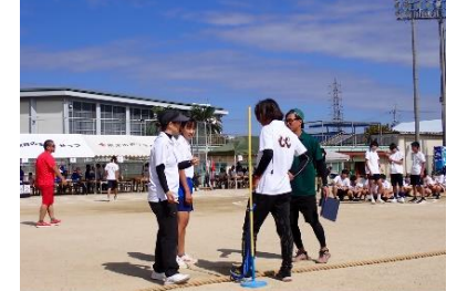
202510 準備が整いました!!【頑張る先生たち】