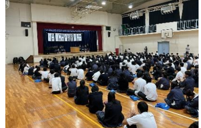
202510 二中をより良くしたい想いがあふれる🥰