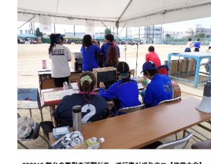
202510 舞台の裏側の活躍があって行事が成り立つ【体育大会】