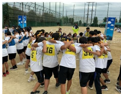
202510 全員チーム総力戦だ🔥【体育大会】