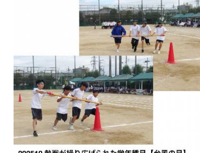
202510 熱戦が繰り広げられた学年種目【台風の日】