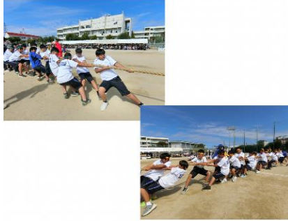
202510 気持ちをそろえて「せーの!!」【体育大会】