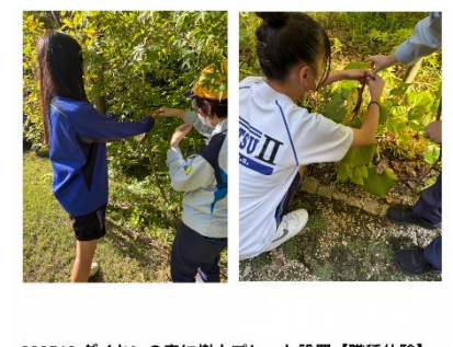
202510 ダイキンの森に樹木プレート設置【職種体験】