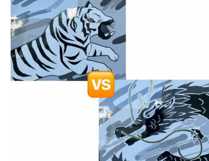
202510 白虎団と黒龍団【体育大会】