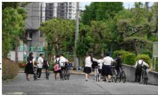
事業所に向けて出発している様子

5月26日～29日には事業所へ事前訪問をしました。今回の事前訪問をとおして、働くことへの理解を深めるとともに、社会人として必要な礼儀やコミュニケーションの大切さを学ぶ貴重な機会となりました。職場体験当日も、感謝の気持ちを忘れず、一人ひとりが充実した学びにつなげてほしいと思います。