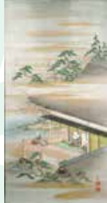
蓮如上人一軸御影(善勝寺)