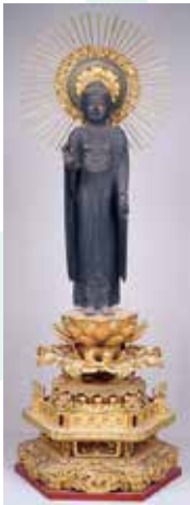
阿弥陀如来立像(勝久寺)