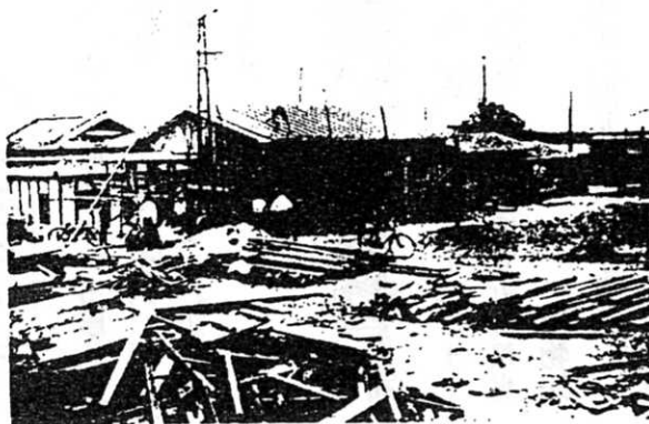
（建設中の初代千里丘駅） 担当（源）

*出征兵士を送るとき、村の人が宮さんに集まって、タイコを打ちラッパを吹いて、並んで千里丘の駅まで送るので、戦前は乗り降りする人もわずかで、駅がにぎわうのはそんな時ぐらいでした。