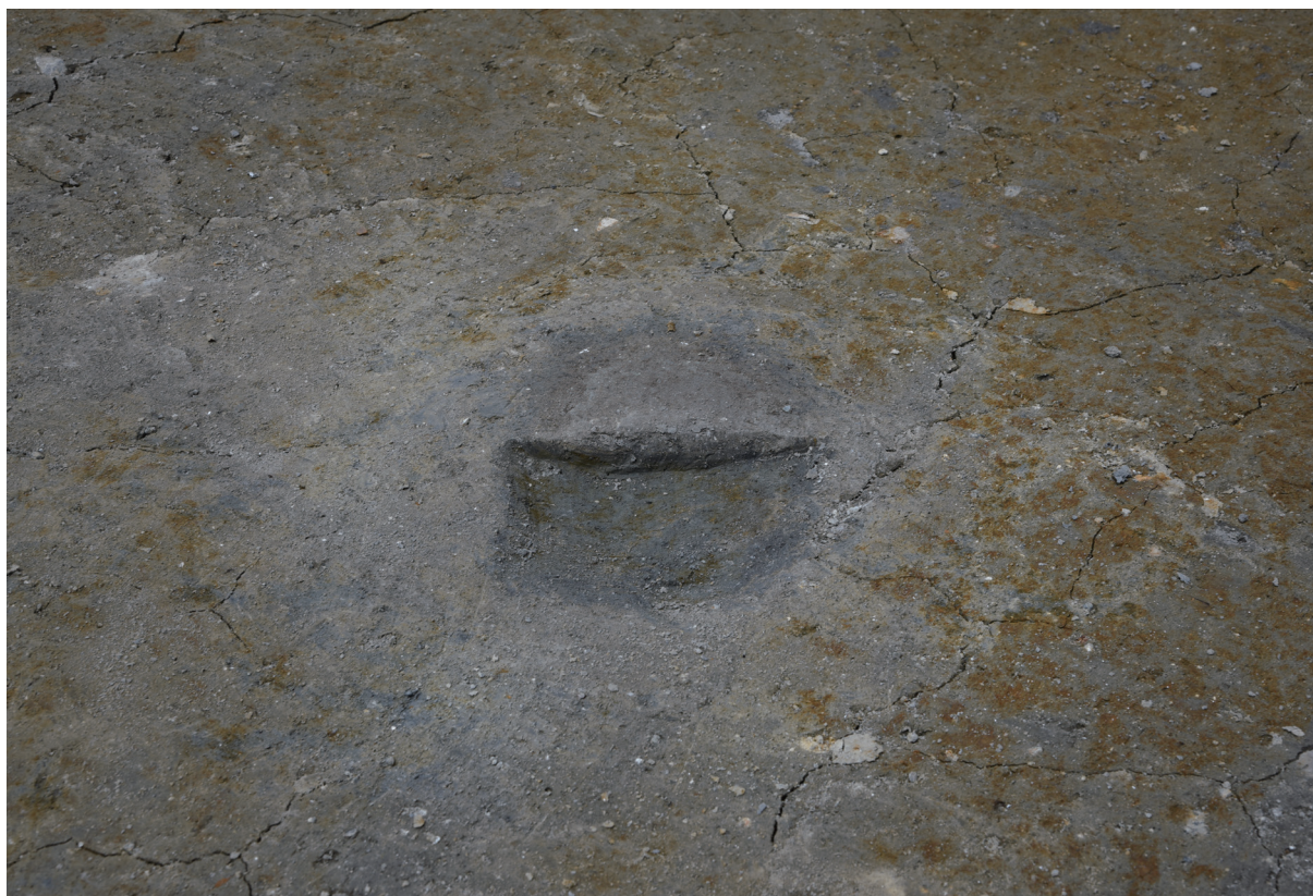
2. 2区第1遺構面ピット8断面（南から）