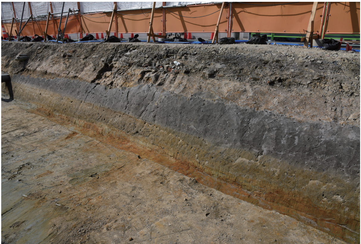
2. 2区東半北壁土層断面（南東から）