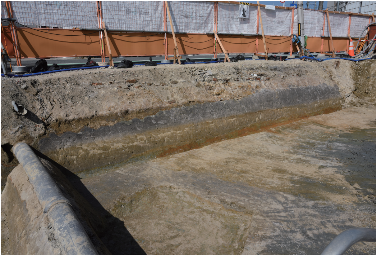
1. 2区東半北壁土層断面（南西から）