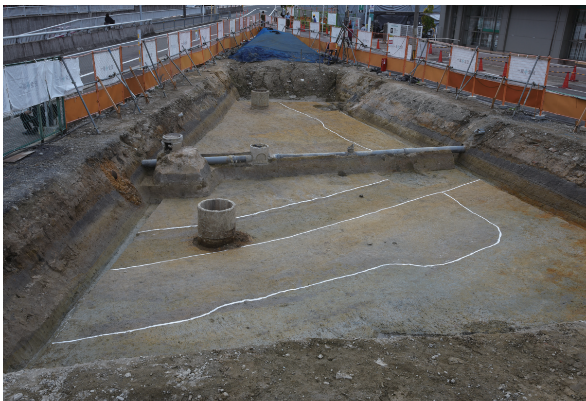
2. 2区第2遺構面全景（東から）