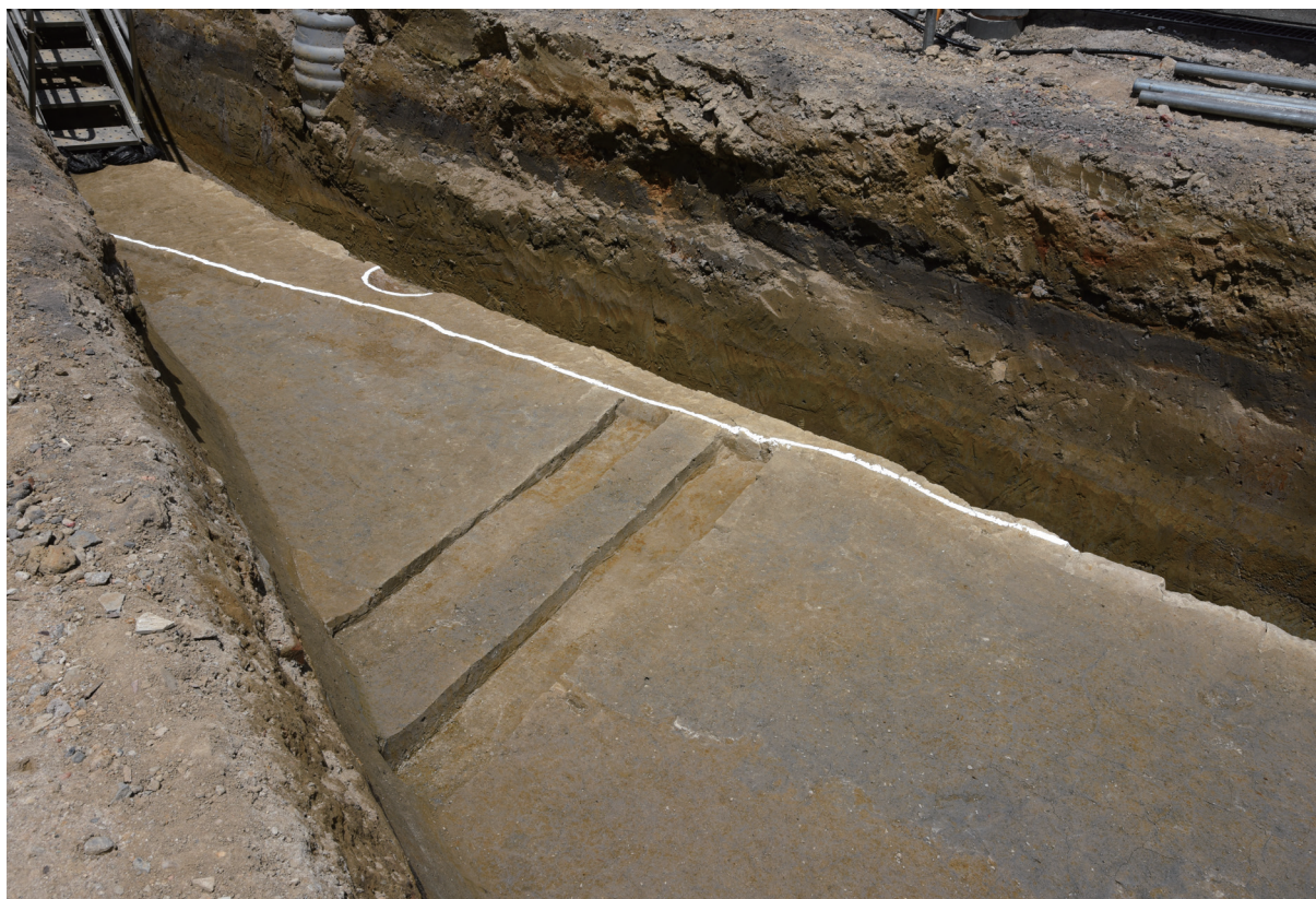
2. 1区第2遺構面遺構群（南から）