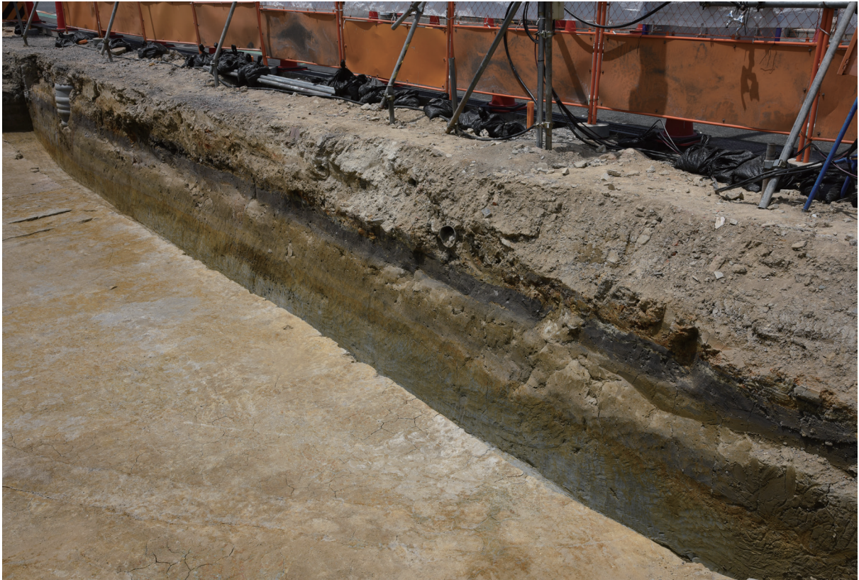
1. 1区北壁土層断面（南から）