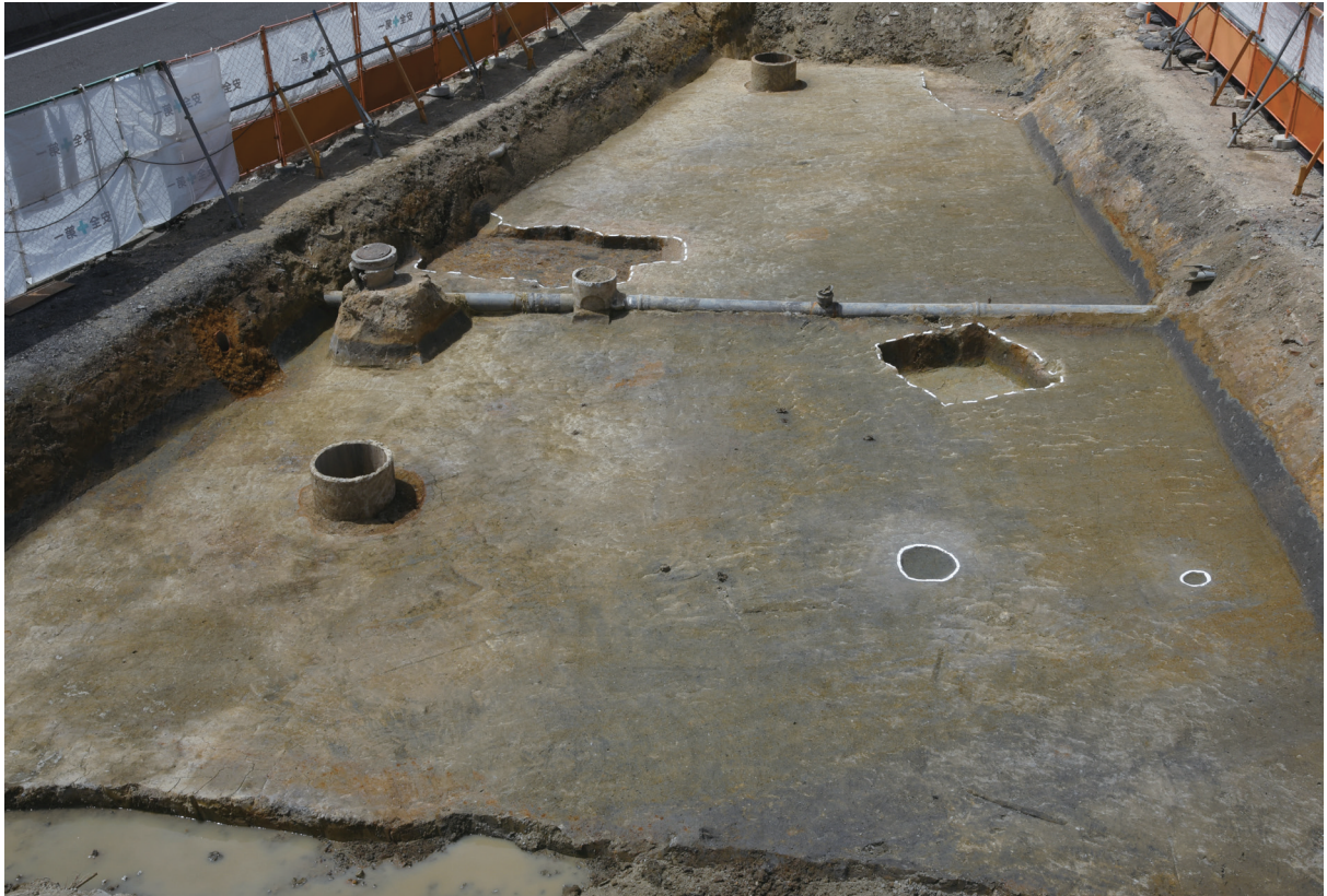
1. 2区第1遺構面全景（東から）