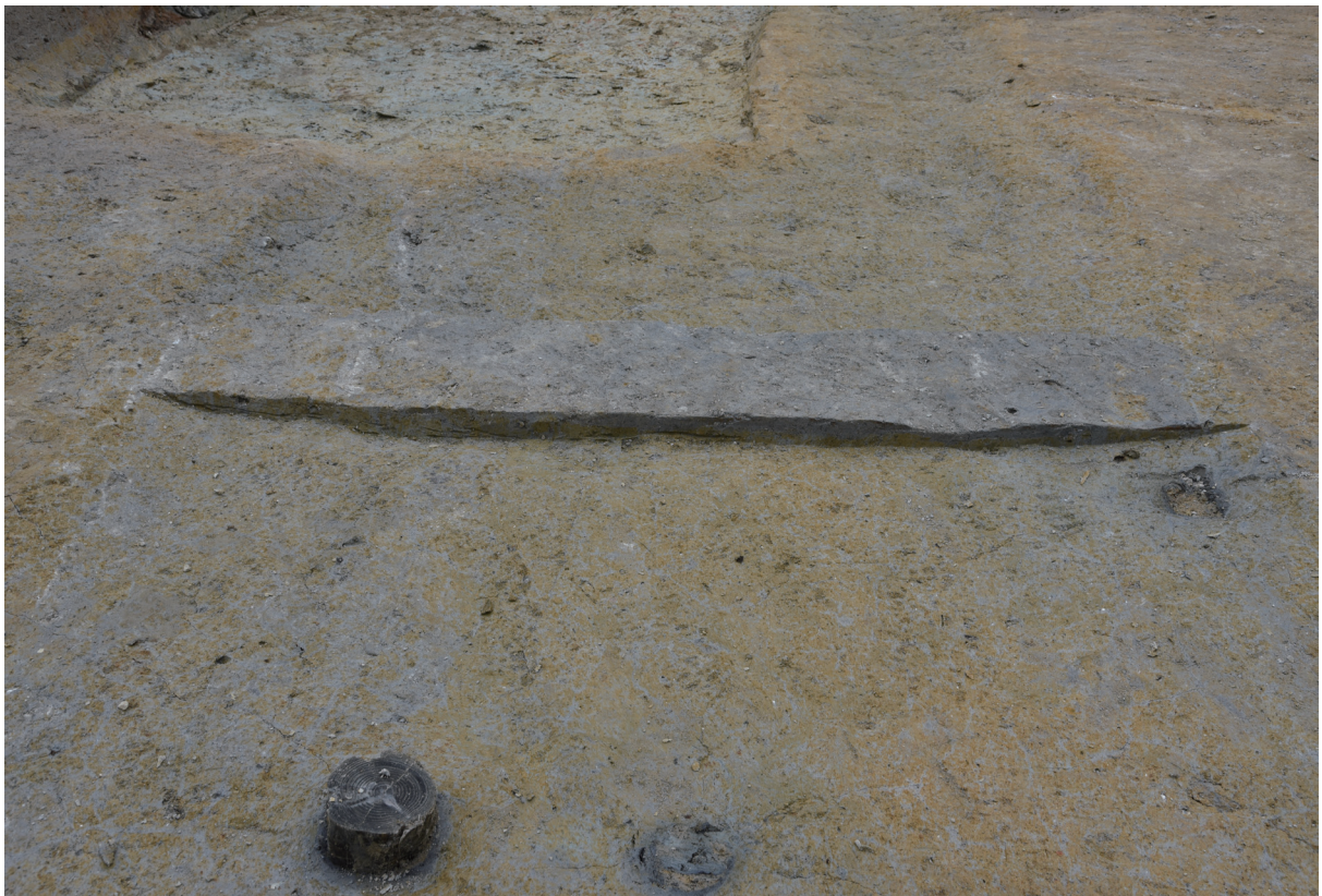
2. 2区第2遺構面溝10断面（南から）