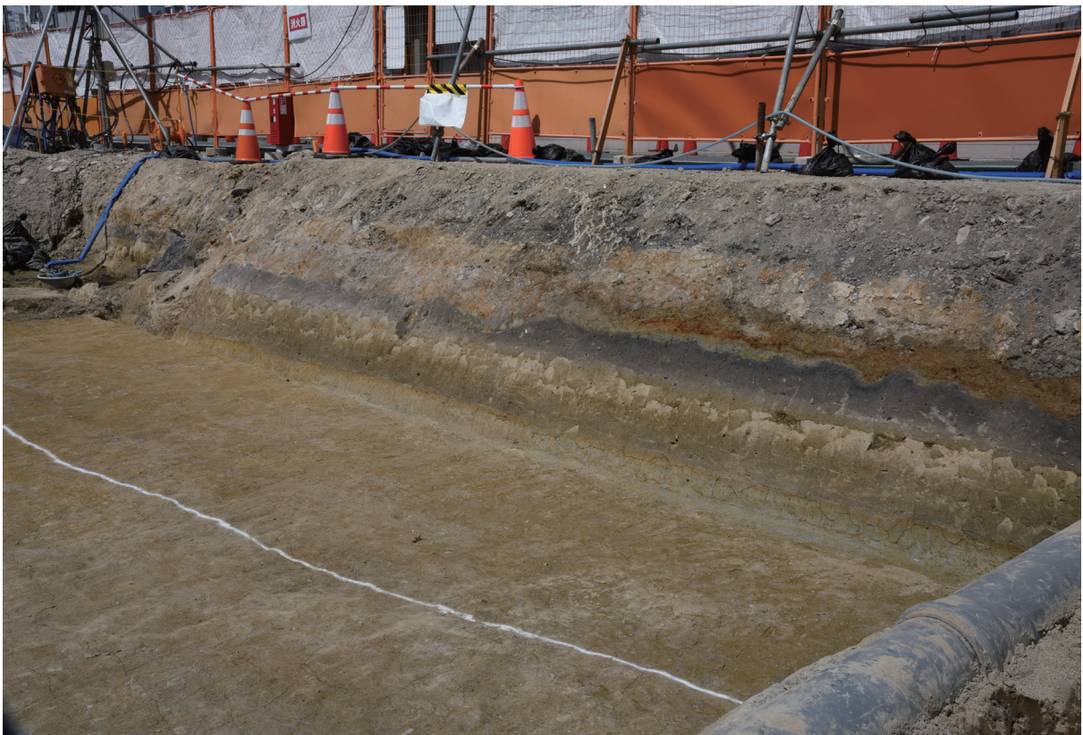
2. 2区西半北壁土層断面（南から）