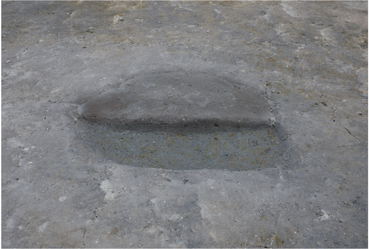
1. 2区第1遺構面土坑9断面（南から）