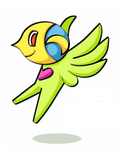
摂津市マスコットキャラクター セツピィ