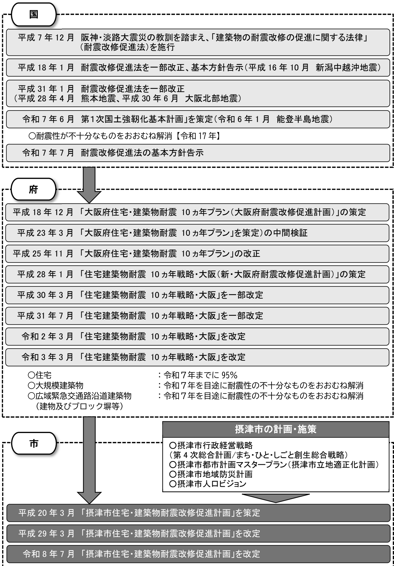
図 0-2 計画の位置づけと関連計画の概要