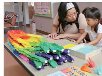
▲第1児童センターの折り鶴コーナー

◆ 平和祈念の折り鶴・平和メッセージ 7月中、平和を祈って「折り鶴コーナー」と「平和メッセージコーナー」を市の公