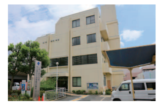
市立休日小児急病診療所

◎市立休日小児急病診療所 問合せ ☎072 (633) 1171 場所 香露園 32-19 診療科目 小児科 (中学生以下) 診療時間 日曜・祝日および 12/31～1/3 = 午前10時～11 時半、午後1時半～4時半 ※受付は診療時間終了30分前まで