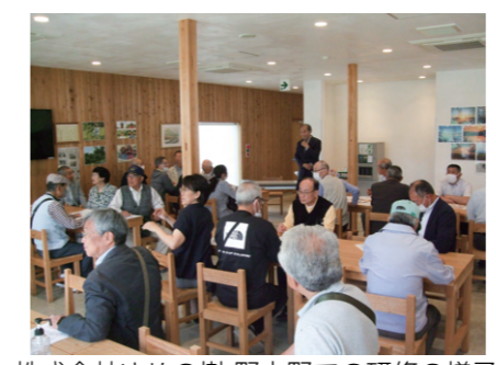
株式会社ゆめの樹 野上野での研修の様子

6月5日、全自治会長対象の研修会で、兵庫県丹波市春日町にある、全国でも珍しい自治会100%出資の自治会法人、株式会社ゆめの樹 野上野へ視察に行き、組織設立の趣旨や、自治会の活性化と自立に向けた仕組みの構築などについて学びました。