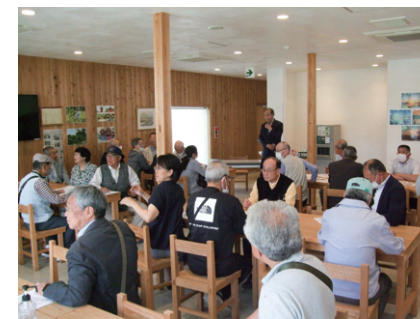
株式会社ゆめの樹 野上野での研修の様子

6月5日、全自治会長対象の研修会で、兵庫県丹波市春日町にある、全国でも珍しい自治会100%出資の自治会法人、株式会社ゆめの樹 野上野へ視察に行き、組織設立の趣旨や、自治会の活性化と自立に向けた仕組みの構築などについて学びました。