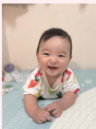
＜七琉ちゃん（正雀）＞ 9カ月「この笑顔守り続 けます！ by 親バカ夫婦」