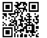
△確定申告書等作成コーナー

※マイナンバーカードの取得は市民課、申告用のID・パスワードの取得は吹田税務署へ