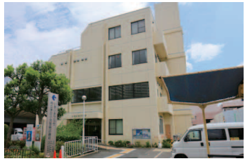
市立休日小児急病診療所

問合せ ☎072 (633) 1171 場所 香露園 32-19 診療科目 小児科 (中学生以下) 診療時間 日曜・祝日および 12/31～1/3 = 午前10時～11 時半、午後1時半～4時半 ※受付は診療開始30分前から