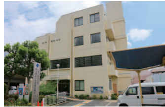
市立休日小児急病診療所