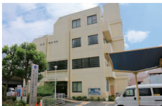
市立休日小児急病診療所

問合せ ☎072 (633) 1171 場所 香露園 32-19 診療科目 小児科 (中学生以下) 診療受付時間 日曜・祝日および 12/31～1/3 = 午前9時半～11 時半、午後1時～4時