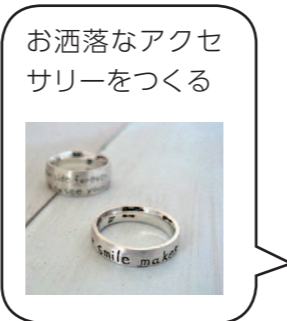
お洒落なアクセサリーをつくる

お知らせ／募集 相談 健康 公民館・コミセン スポーツ・文化 図書館 施設催し／教育ほか 福祉 産業振興 子育て 地域／市民活動 ごみ・資源