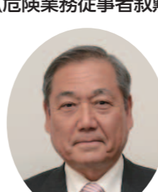
瑞宝単光章 (危険業務従事者叙勲) 元摂津市消防司令 (東別府4丁目)