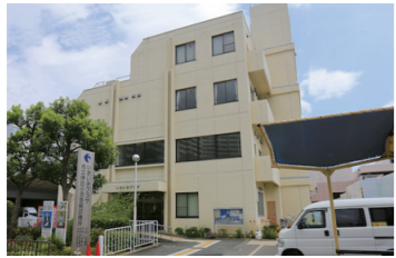
市立休日小児急病診療所

◎市立休日小児急病診療所 問合せ ☎072 (633) 1171 場所 香露園 32-19 診療科目 小児科 (中学生以下) 診療時間 日曜・祝日および 12/31～1/3 = 午前10時～11 時半、午後1時半～4時半 ※受付は診療開始30分前から