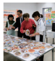
食事バランスチェック