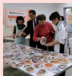
食事バランスのチェック