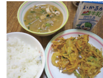
▲ゴーヤの寄せ揚げ

9月4日、市役所やコミュニティプラザ、いきいきプラザなどで育成したグリーンカーテンのゴーヤが、小学校給食で「寄せ揚げ」になって登場しました。 グリーンカーテンは、公共施設などの窓に沿わせて植物を植え、日差しを遮り室内の温度上昇を