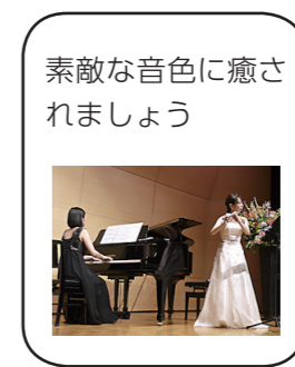
素敵な音色に癒されましょう

せは生涯学習課へ ◆フレッシュコンサート 摂津音楽祭本選出場者によるクラシックコンサート 10月23日(日)午後2時～4時に、安威川公民館で/問合せは文化スポーツ課へ