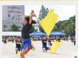
別府小 こどもたちの持つ力を地域に お返しできる学校