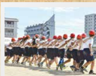
摂津小 みんなの気持ちを一つにして