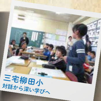
三宅柳田小 対話から深い学びへ