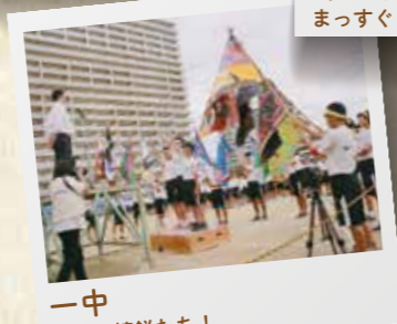
一中 一中の精鋭たち!