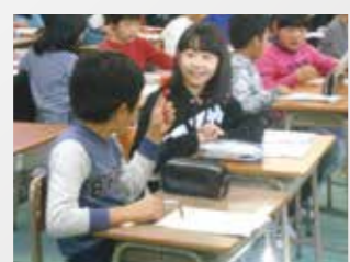
鳥飼西小 「Tell Each other!」