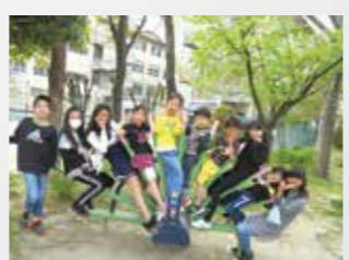
鳥飼東小 みんなでクジャク