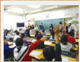
鳥飼北小 ～教えることで学ぶ～