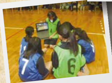
四中 みんなで育む「確かな学び」