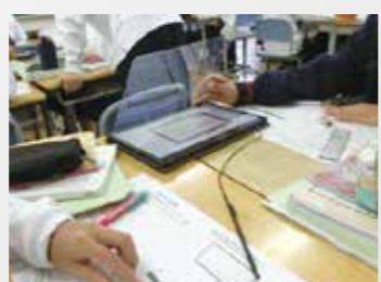
五中 グループ学習で! PCを使って! 主体的に参加でき、達成感を味わうこと ができる授業をめざします!