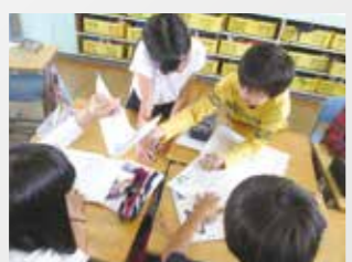
味生小 すばらしき言語活動の世界