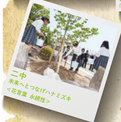
二中 未来へとつなげハナミズキ <花言葉 永続性>