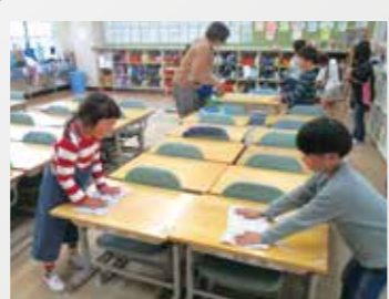
千里丘小 「きれいになあれ!」と拭いて いる、あなたの心が美しい。