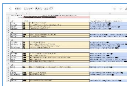
写真3：共同作業で進捗状況を確認しながら課題を完成させているシート。