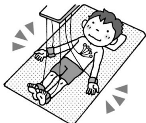
② 手首・足首・胸に器具をつけてもらいます