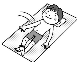
① ベッドに横になります