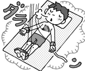
③ ダラーンと力を抜いて動かない