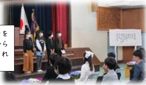
最高学年のバトンを受け継ぐ5年生から贈る言葉が述べられました。