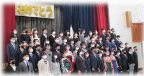
巣立っていく6年生の姿は堂々たるものでした。6年間の学びを胸に、中学校でも頑張ってください。