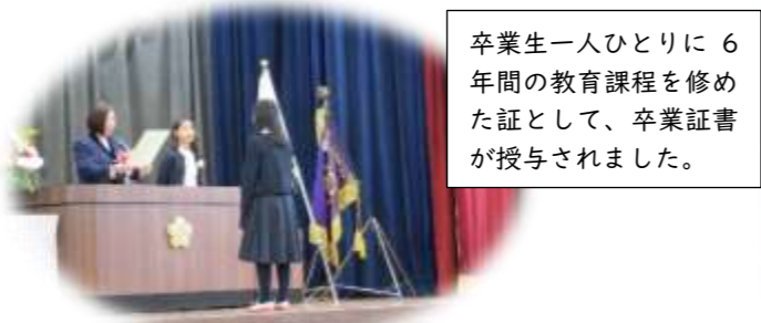
卒業生一人ひとりに6年間の教育課程を修めた証として、卒業証書が授与されました。