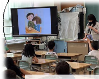
お話一座の方々による 絵本の読み聞かせ