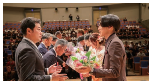
△花束の贈呈を受ける様子

1月12日(祝)、市民文化ホールにおいて「令和8年二十歳のつどい」を開催しました。今年は平成17年4月2日から平成18年4月1日まで生まれた541人が式典に参加しました。 会場には、真新しいスーツや華やかな振袖に身を包んだ参加者たちの、旧友との久しぶりの再会に笑顔をおぼす姿や、二十歳を迎えた喜びを分かち合う様子がみられ、会場は終始温かい雰囲気包まれていました。 式典では、市長による