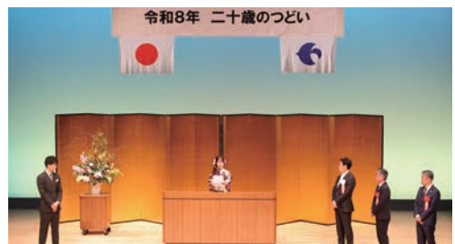
△誓いの言葉を述べる様子