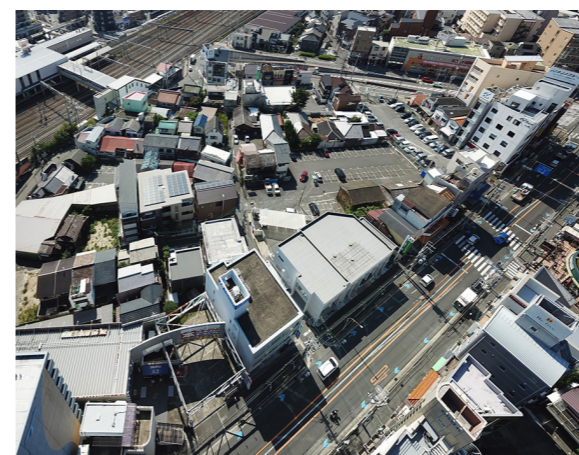
△現在の再開発地区（北側から・左奥が JR 千里丘駅）