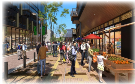
△シンボルロードでのイベントイメージ