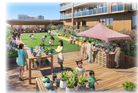
△屋上庭園でのイベントイメージ