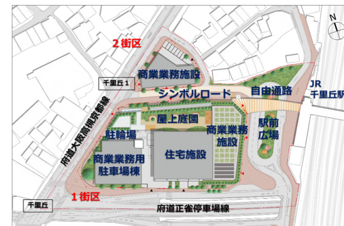
△再開発事業計画図