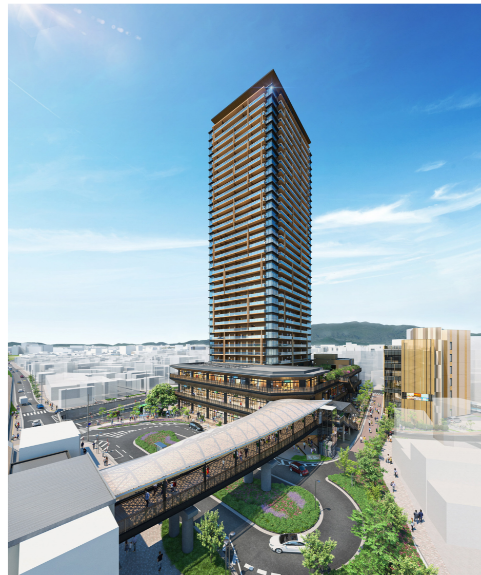
△再開発ビル・駅前広場完成イメージ (JR千里丘駅から)