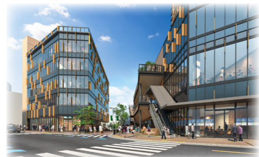
△千里丘1丁目の交差点から本地区を望む