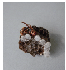
▲アシナガバチの巣