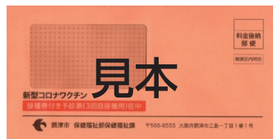
▲接種券付き予診票送付封筒（オレンジ色）