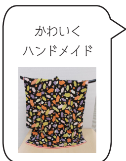
かわいく ハンドメイド

10月17日～12月5日の月曜日午後1時半～3時半(計8回)／定員4人／教材費1千500円／要申込み(☎可・先着)