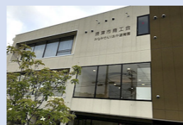
△ビジネスサポートセンター外観