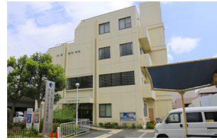
市立休日小児急病診療所

問合せ ☎072 (633) 1171 場所 香露園 32-19 診療科目 小児科 (中学生以下) 診療時間 日曜・祝日および12/31~1/3 = 午前10時~11時半、午後1時半~4時 ※受付は診療開始30分前から ※発熱のある人は事前連絡のうえ、受診してください。