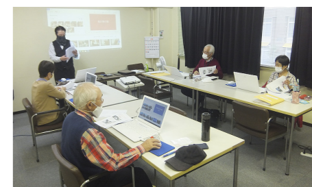
パソコンをもっと知ろう科▲