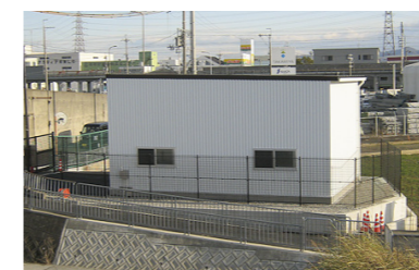
△三箇牧水路と雨水幹線の分岐点（鳥飼八町）

市では、安威川以南の雨水対策の一環として、三箇牧鳥飼雨水幹線を設置しました。 三箇牧水路を流れる雨水が一定量を超えると、今回設置した雨水幹線を通り、摂津ポンプ場経由で安威川に放流する仕組みになっています。 三箇牧鳥飼雨水幹線工事は、平成29年3月から実施されており、昨年10月から供用を開始しています。