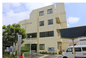
市立休日小児急病診療所