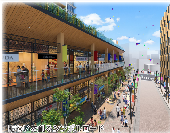
賑わいを創るシンボルロード