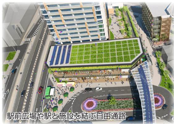
駅前広場や駅と施設を結ぶ自由通路