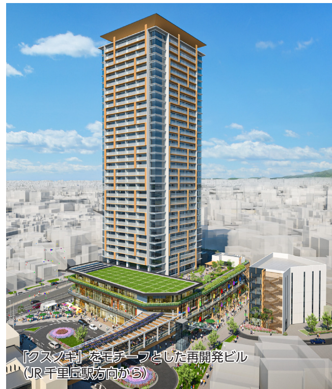
「クヌギ」をモチーフとした再開発ビル (JR千里丘駅方向から)