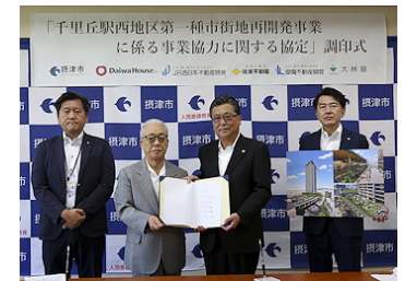
△協定締結時の様子

※事業協力者とは、事業検討のパートナーで、市が策定する事業計画や権利変換計画に係る各検討事項に対し、助言や提案などを行うもの