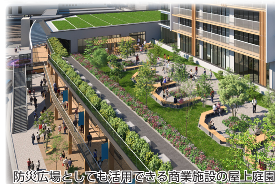
防災広場としても活用できる商業施設の屋上庭園