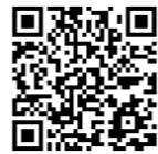
申込みフォーム(市ホームページ)

※上記受付日に願書を提出できない場合は、10月7日(水)午前10時~午後4時に各施設および同課で受け付け。定員を超えた場合は抽選。