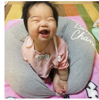
おと 響巴ちゃん(一津屋)9カ月 「いつもみんなを笑顔にしてくれてありがとう!」