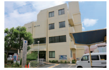
市立休日小児急病診療所

◎市立休日小児急病診療所 問合せ ☎ 072 (633) 1171 場所 香露園 32-19 診療科目 小児科 (中学生以下) 診療時間 日曜・祝日および 12/31～1/3 = 午前10時～11 時半、午後1時半～4時 ※受付は診療開始30分前から