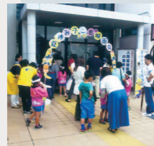
△夏休み子ども映画会 ▷親子ランド

夏休み子ども映画会の開催や親子ランド、子育てサロンへの協力など、子どもがいいきと育む活動を行っています。