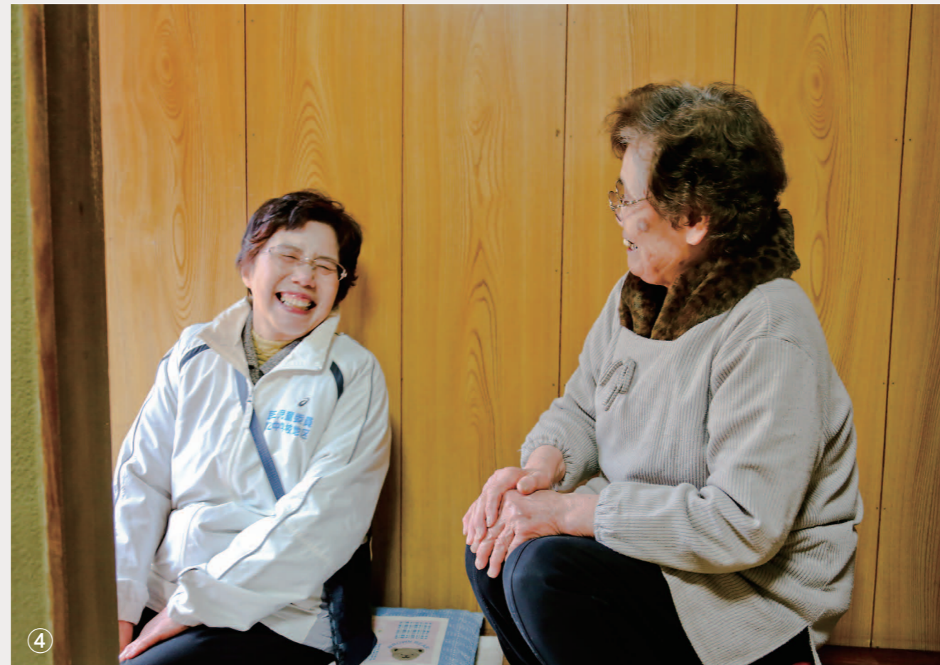
①親子サロン②クリスマスツリーの飾り付け（公民館）③リハサロン ④一人暮らし高齢者訪問（友愛訪問）