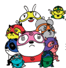
環境業務課マスコットキャラクター 「もったいナイン」

資源や水銀使用製品は、それぞれに出し方の決まりがあります。お住まいの地域ごとの収集日を確認して、それぞれ決められた場所に、決められた方法で出してください。