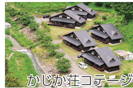
かじか荘コテージ