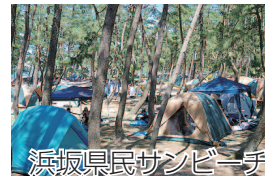
浜坂市民サンプレー